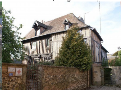
La maison du bailliage (inscrite MH)