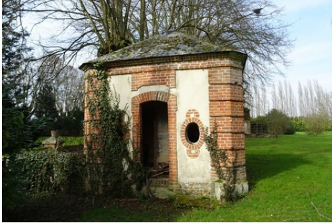
Un pavillon d'angle du parc