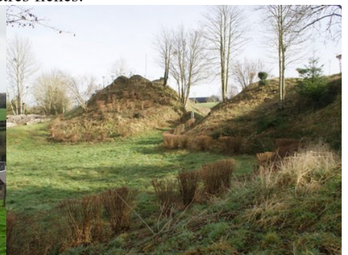
L'enceinte féodale (vestiges inscrits)