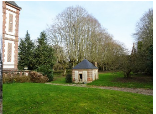
Le pavillon d'angle sud-est et le parc