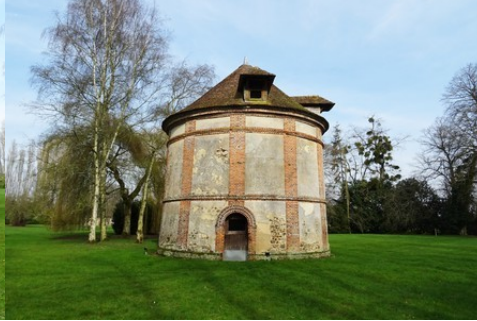
Le colombier circulaire