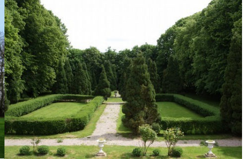
Quelques vues sur le parc vers l'Est