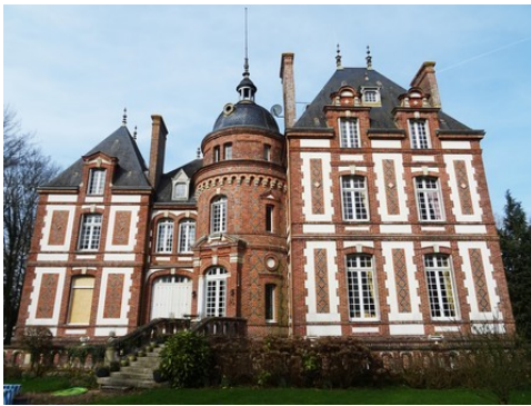
La façade sud et la tourelle d'entrée