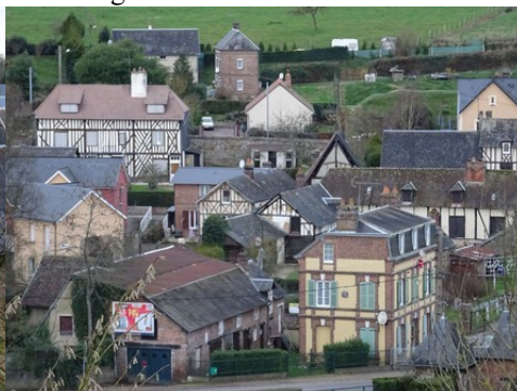
Des maisons en briques ou à pans de bois