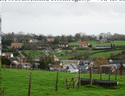
Une vue générale sur la vallée du Guiel