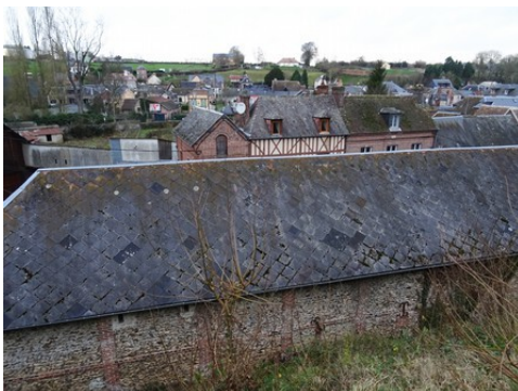
Quelques vue du village de Montreuil