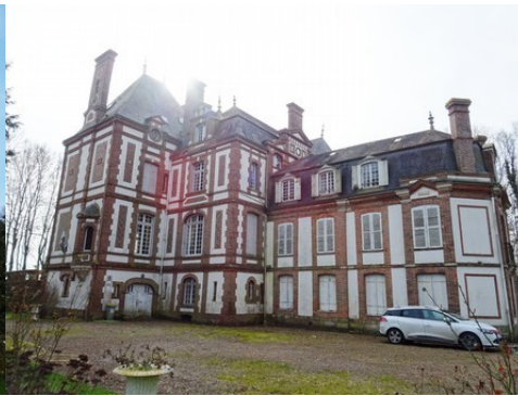
La façade est depuis les jardins